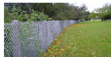
► Plusieurs dimensions