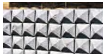
► Finition pointe de diamant