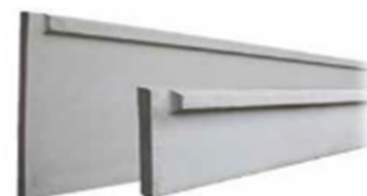
► Finition pointe de diamant et percement sur le côté pour le passage des fils de fixation

Produits certifiés et marqués CE EN 12839