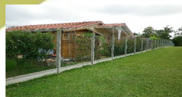
► Finition avec plaque