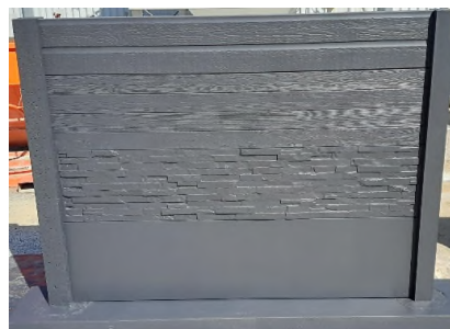
► Clôture écran après application du minéralisant teinté ton gris anthracite