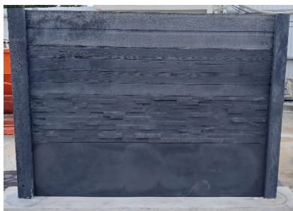
► Clôture écran avant application du minéralisant teinté ton gris anthracite

Ce produit est classé sans danger, mais le port d'équipement de protection individuelle est recommandé.