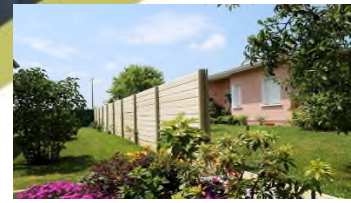
► Finition droite