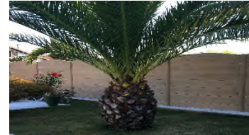
► Finition cintrée