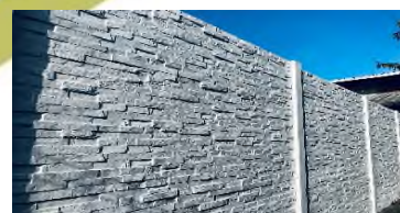
► Finition droite