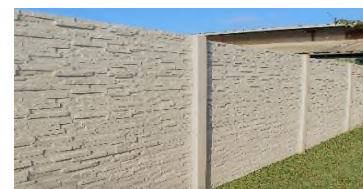
► Existe en simple ou double face