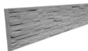
► Plaques compatibles avec les poteaux rainurés réversibles en démoulage immédiat de notre clôture écran Classique

Produits certifiés et marqués CE EN 12839