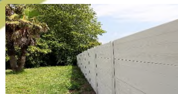
► Finition droite