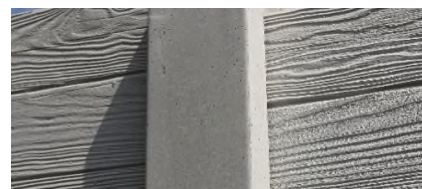
► Poteau carré