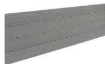
► Plaques compatibles avec les poteaux rainurés réversibles en démoulage immédiat de notre clôture écran Classique

Produits certifiés et marqués CE EN 12839