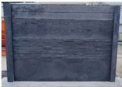
► Clôture écran avant application du minéralisant teinté ton gris anthracite

Ce produit est classé sans danger, mais le port d'équipement de protection individuelle est recommandé.