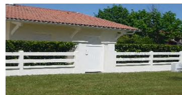
► Style modulable