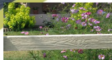
► Finition aspect bois