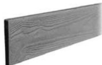
► Déclinable en plusieurs hauteurs et en différents coloris

Produits certifiés et marqués CE EN 12839